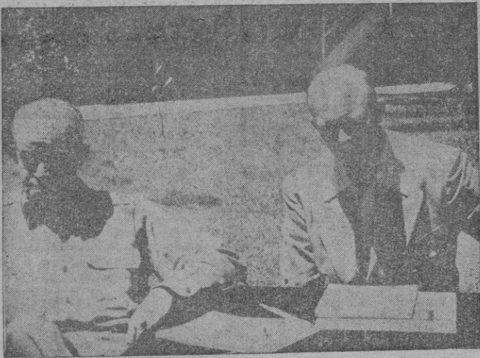
Key West (Florida). — El Jefe del Estado Mayor del Ejército, general Omar Bradley con el general Eisenhower, consejero militar de la Secretaría de Defensa, durante la conferencia que ambos celebraron en Key West, recientemente.

DOS GRANDES JEFES MILITARES NORTeamERICANOS CONFERENCIAN