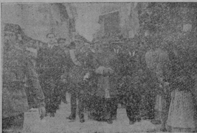
Nuestras primeras Autoridades recorren las calles engalanadas de Petra, durante la inolvidable jornada juniperiana celebrada el martes en aquella Villa.