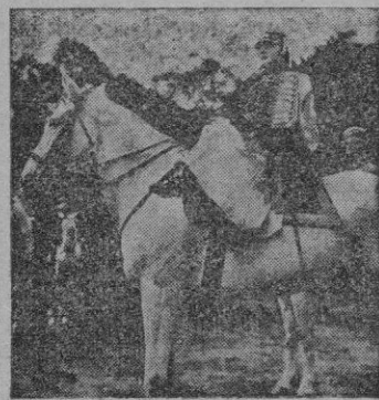
Una escena del film.

La película, en un estilo harto sensiblero, cuenta algunos aspectos de la vida aventurera del guerrillero mejicano Alvarado, durante los días del Emperador Maximiliano, con situaciones no exentas de interés.