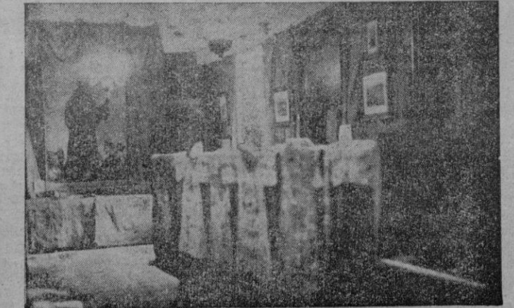
Una vista de la interesante exposición juniperiana instalada en el salón de actos del Convento de San Francisco.