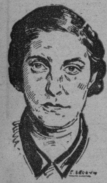
PILAR PRIMO DE RIVERA