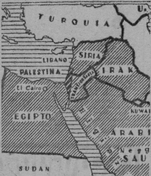
Palestina, zona rodeada de árabes menos por el mar

Las luchas que tienen lugar en la región de Negab, y la presencia de fuerzas israelitas en la frontera egipcia, han venido a complicar el problema de Palestina. Lo cierto es que las tropas británicas localizadas en la zona del canal de Suez se mantienen en alerta; que los aviones de la RAF practican reconocimientos de las comarcas fronterizas sobre las que se mueven las operaciones judías, y que algunas unidades navales inglesas acuden previsivamente al Mediterráneo oriental. Es decir, Londres mueve sus fuerzas en tiempo oportuno, anticipándose a posibles conflictos, porque los tratados con Egipto y Transjordania obligan en efecto, a la Gran Bretaña a intervenir en favor de ellos si estos países son atacados o invadidos. No creemos por ello, que Israel se arriesgue, a sabiendas, a una aventura en la que podría perder de golpe mucho de lo que ya ha conseguido. Otra cosa es la actitud de las fuerzas judías en Negab, donde se hallan cercados no menos de diez mil soldados egipcios, que podrían recuperarse y salir de su difícil situación si se restablece la tregua impuesta por el Consejo de Seguridad, que Tel-Aviv no se halla dispuesto a observar de buen grado.