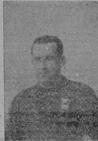
Company, el portero del Constancia, que ha vivido la época más interesante de los Constancia-Mallorca

En el ímo de todos, está el +4 del Mallorca y el +1 del Constancia. Fijese el lector en el detalle de lo que podría ocurrir, si venciera el Constancia. Mientras el Mallorca restaría dos puntos positivos y se quedaría por tanto +2 en la clasificación, el Constancia sumaría +3 y le sobrepasaría en un punto en la clasificación real. ¿Tiene o no tiene, pues, consecuencias graves este encuentro? ¿Puede o no puede perjudicar de veras al Ma-