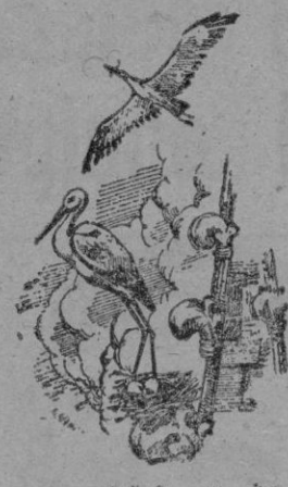
...esa cigüeña que ha aterrizado en Sevilla...

No es éste gay la ola de frío, tan conguero y tropical como esa famosa gola marinay que se baña en las cinco partes del mundo. Más bien es un decidido saludo al invierno, que ya llega, confundiendo a doña Cigüeña. Doña Cigüeña es sabia y conoce sus clásicos. Sabe que pocos lugares hay tan propicios al invierno como los del este de África meridional, y libre de pasaportes, declaraciones de divisas y múltiples visados cuando da por terminada su temporada europea, se lanza por el Bósforo, Asia Menor, Nilo arriba, hasta llegar a su residencia de vieja millonaria. O bien por Andalucía el Estrecho, a tomar una línea derivada que lleve al mismo punto. Pero si la cigüeña sabe marcharse, es indudable que también sabe volver y en el refranero está la muestra de su puntualidad; por San Blas, la cigüeña verá.