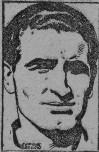
APARICIO el mejor defensa central de España.

Barcelona 30.—Ha sido designado oficialmente el once español que el próximo domingo se enfrentará en el Estadio de Montjuich al equipo belga, en el IV encuentro entre las selecciones de ambos países.