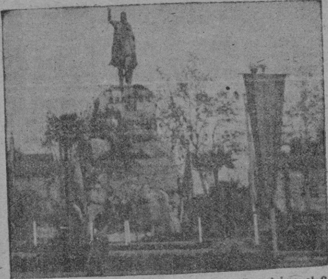
Hoy, desde lo alto de su caballo, nuestro Rey Don Jaime el Conquistador, recibirá el homenaje de su pueblo en el día-aniversario de la Conquista de Mallorca. Banderas y gallardetes signarán los actos conmemorativos de las fiestas de hoy, recuerdo de aquél 31 de Diciembre de 1229, glorioso hito de la historia isleña recuperada para la cristiandad.

AÑO X 3-: NUMERO 2.843 PRECIO: 50 CENTIMOS Suscripción mensual: 10 pesetas