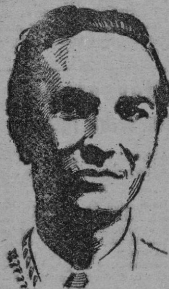
LUIS MIGUEL DOMINGUÍN