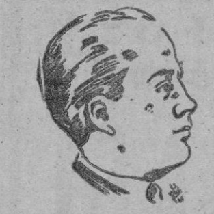
ROMULO GALLEGOS novelista venezolano que vive políticamente sus propias novelas.

resina, el pueblo vive sin el nivel de vida lógico dada la situación y riqueza del país. Que en ese mismo año, por poner un ejemplo, las importaciones su-