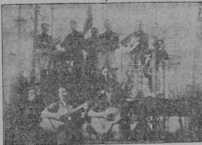
La Rondalla Provincial del Frente de Juventudes, formada por doce cadetes de las Falanges Juveniles de Franco, que obtuvo un extraordinario triunfo en el Teatro Principal de Inca

El acto del Teatro Principal constituyó un gran éxito