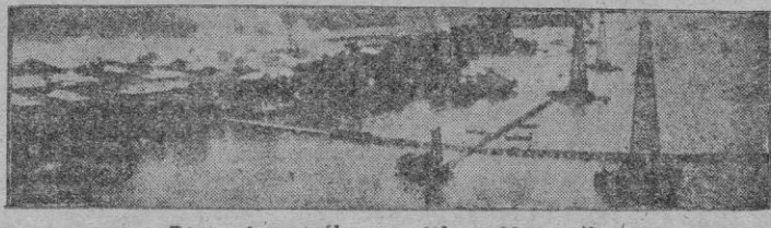
Pozos de petróleo en el lago Maracaibo