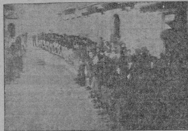
Cadetes y Flechas alineados en la plaza del Ayuntamiento de Inca; constituyeron el pasado domingo la nota simpática y juvenil que llenó de alegría los ámbitos de aquella ciudad

Los actos celebrados con magnífico esplendor el pasado domingo en Inca, fueron un preámbulo del «Día de la Madre», que con tanto fervor festeja todos los años el Frente de Juventudes.