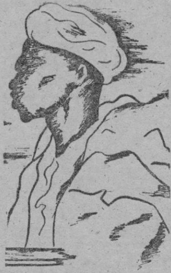
La recia silueta de un tirador de Ifni. Fieles seguidores de España, héroes en su Guerra de Liberación...