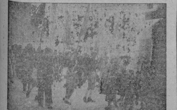
Auténtica labor de captación y de henchido patriótico fué la realizada el domingo en Inca por las Falanges Juveniles de Franco. Los chiquillos de la industrial ciudad, seguían con entusiasmo los pasos marciales de los cadetes y flechas