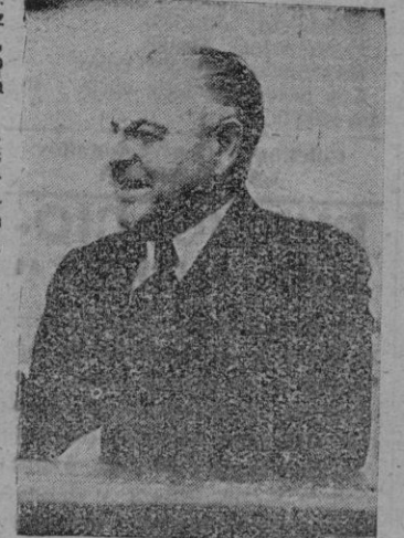
WARREN AUSTIN una voz de la auténtica América en la O.N.U.

La manteca soviética es aquella y sus protagonistas son tercos. La destrucción de la producción atómica sin saber si la Unión Soviética posee tal arma, sería una victoria comunista, cuya amenaza han comprendido los Gobiernos aliados. Hombres de la talla de Austin, cuya vida política sigue paralela a una recta línea patriótica, son los encargados de paralizar argumentos tan miserables como los expuestos por Malik en sus contestaciones. Nada representa esa «conspiración del silencio» de Inglaterra y Estados Unidos a la nota rusa al lado del infranqueable «león de acero», tras el cual el Kremlin prepara el ataque. Rusia no descubrirá su secreto, pero el mundo, a través de hombres como Warren Austin, irá conociendo al mundo, son los provocadores y dónde están los asesinos que aspiran a destruir esta tierra paz.