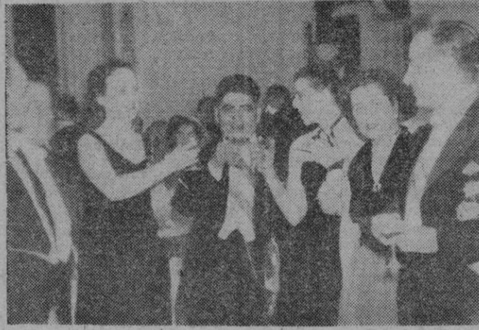
El nuevo Presidente de la República del Paraguay, don Natalicio González, con un grupo de invitados a la toma de posesión, entre los que se encuentra el embajador extraordinario enviado por España, Conde de Motrico.