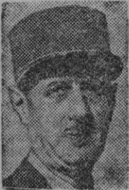
DE GAULLE se aproxima su hora

Terrible paradoja la de este militar-político al que Roosevelt, con su sabia malicia electorera de «slogan» y síntesis, llamó el «Juan de Arco». Hay quien suba al poder para destruir la obra de sus adversarios. Si Francia le otorgara la gobernación tendría que destruir el andamiaje de un edificio que él mismo formó. Los males de Francia vienen de aquel contubernio comunista-degaullista. Así lo pensaba Pétain desde los barrotes de su prisión de anciano prócer; así lo dictaminará, vestido con uniforme carcelario el ilustre Charles Maurras, y los huesos de tanta víctima en aquellos días desenfrenados en los que se olvidaron las razones de Pascal y los fríos postulados de Descartes. Pero venga quien venga la cátedra de Francia la tenemos abierta para aprender lecciones experimentales. Las «terceras fuerzas», los políticos de la «tierra de nadie», las medias tintas no tienen que hacer nada en un Mundo turbulento y que reclama soluciones de urgencia.