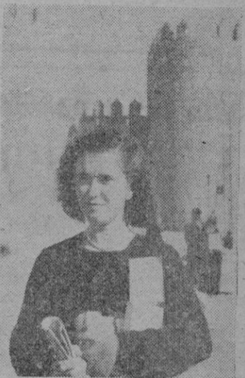
Avila.—Esta muchacha acaba de recoger el suministro gratuito de pasta para sopa elaborada con la harina regalada por la esposa del presidente argentino, doña María Eva Duarte de Perón a las ciudades que visitó durante su estancia en España.

DISTRIBUCION DEL DONATIVO DE LA ESPOSA DEL GENERAL PERON