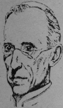
S. S. PIO XII

La actividad preelectoral italiana adquiere cada día mayor excitación y debe esperarse en las próximas semanas una mayor tensión. En ella se nota gran influencia de los acontecimientos internacionales, proyectándose sobre el eje de futuros muy distintos, opuestos según la concepción de ambos bandos en lucha.