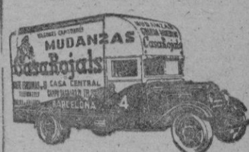
Siete Esquinas, 5 Tel. 2227 Palma