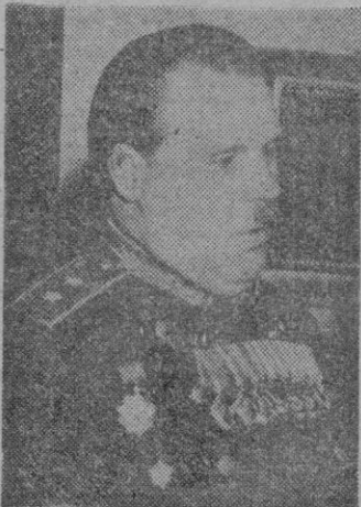
El general soviético Savonenkof —con traje de gala y condecoraciones—, que entregó al presidente Paasikivi la carta de Stalin, proponiendo una alianza militar entre los dos países.