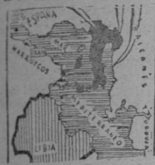
En Italia puede romperse definitivamente la paciencia de Norteamérica.

Los dos discursos de Truman han sido el más violento alegato de Norteamérica contra la U.R.S.S. Las últimas amarras cordiales que pudieran existir entre los dos colosos se han roto definitivamente. De hecho, hay que reconocer la existencia de una guerra diplomática, política y comercial entre ambos Estados, y lo que resulta más serio, una réplica al continuo rearme ruso con el rearme eficiente, progresivo y espectacular de los Estados Unidos. A pesar de la violenta dialéctica empleada y de la psicosis de guerra nacida en tal ambiente, seguimos creyendo que ni Rusia ni Norteamérica de sean la última razón bélica.