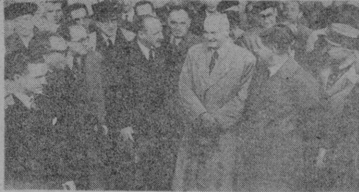
Primeras fotos sobre la reciente apertura de la frontera hispano-francesa. A la izquierda, el Alcalde de Hendaya y otros miembros del Ayuntamiento de aquella ciudad saludan a las autoridades españolas en el acto de la reapertura. A la derecha el vecindario de Puigcerdá espera sobre el puente internacional el momento de iniciarse la histórica ceremonia que ha vuelto a poner en comunicación a los pueblos francés y español.