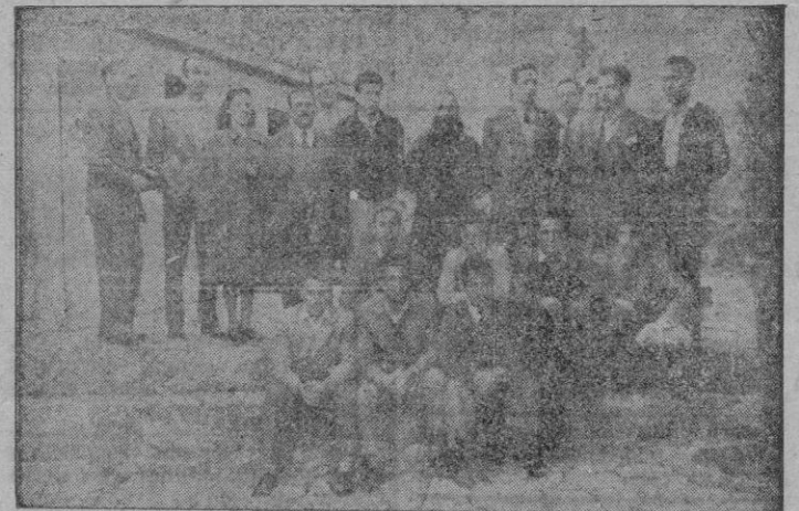
Dos fotografías obtenidas por «Juanet» en la tarde de ayer en la Ermita de Valldemosa, en las que aparecen los jugadores del «Mallorca» que han sido concentrados en aquel pueblo en vísperas del trascendental partido de esta tarde

guien dá la noticia: fueron a meditar a la Ermita. Y a la Ermita vamos.