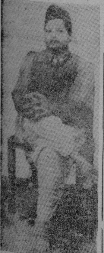
Nathuram Vinayak Godse, el asesino de Gandhi.