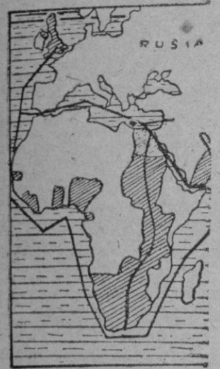
África gira dentro de la órbita de Inglaterra y Francia.

Se anuncia la creación de un Bloque euroafricano de pacificación entre Norteamérica y Rusia; en realidad, de lo que se trata es de coordinar los esfuerzos anglofranceses para crear un frente contra la influencia de las dos grandes energías que quieren repartirse el predominio universal, África, gira, desde luego, dentro de la órbita predominio de Inglaterra y Francia; por ser depósito de materias primas y por su posición estratégica puede constituir una clave importante en la lucha por la hegemonía del Mundo.