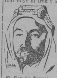
El Rey de Transjordania

activa en el enrolamiento de elementos árabes para el Ejército del emir Faisal, después de la captura de Jerusalén en 1917.