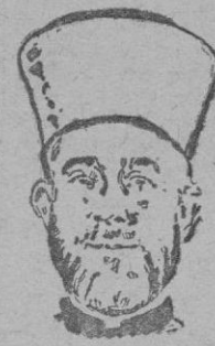
El Gran Mufti

Madrid. — En la Escuela de Armas Navales de la Ciudad Lineal ha tenido lugar la entrega de despachos a la primera promoción del Cuerpo Facultativo de Armas Navales que sale de esta Escuela. El acto fué presidido por el Ministro de Marina que impuso la Cruz del Mérito Naval al primer alumno de la promoción y a un profesor de la Escuela. — Cifra.