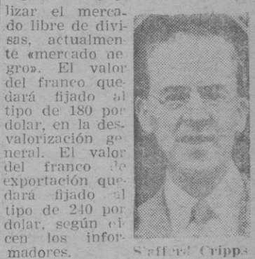
Sir Stafford Cripps

París. — En los círculos autorizados se dice que el Gobierno francés ha acordado desvalorizar el franco, crear el franco de exportación y posiblemente legi-