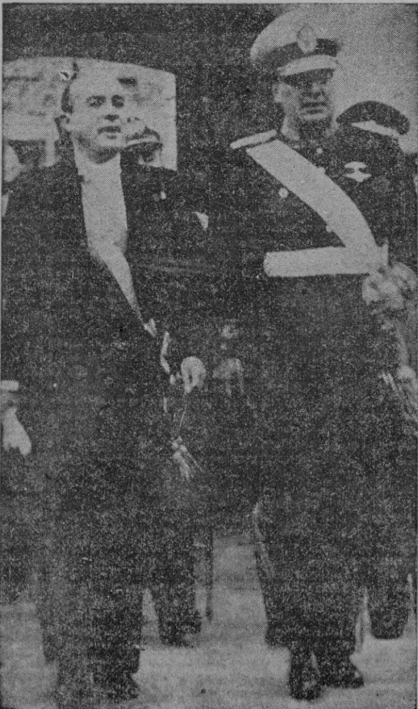
Instantánea tomada después de la entrevista del Presidente de Argentina General Perón con el Presidente de Chile Dr. González Videla, con la que se consolidaron más las estrechas relaciones entre ambas repúblicas suramericanas tan unidas en su lucha contra el peligro comunista.