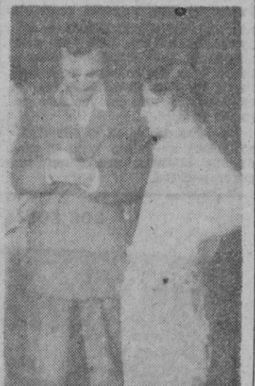
Nuestro Redactor entrevistando a uno de los obreros de «Manufactura general del caucho».

continuidad de los beneficios que la gestión del representante anterior les ha reportado. Es ahora un obrero, socarrón él que cubría su cabeza con un gorriño de legionario, ya que me explicó ha permanecido varios años en una bandera del Tercio quien contesta a mis preguntas. —Desde luego que estamos interesados en estas elecciones. Nos constan que de ellas solo bien para nosotros se producirá. —Sí, pero tenga usted en cuenta que también adquieren ustedes una responsabilidad puesto que se les llama a colaborar en la tarea común. El no comprende muy bien donde empieza y donde acaba