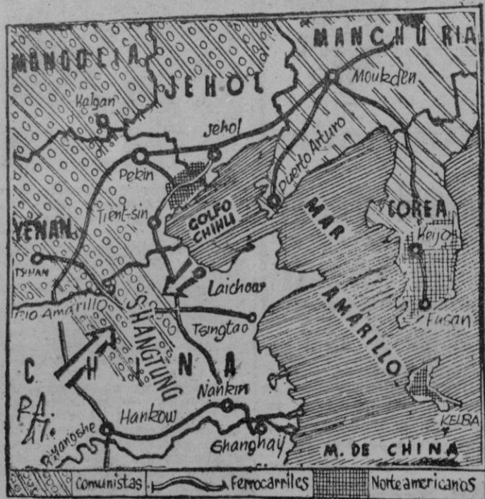
Los Soviets se infiltran por Asia. El croquis marca las extensas regiones dominadas por el comunismo, es decir, prácticamente, por Moscú.