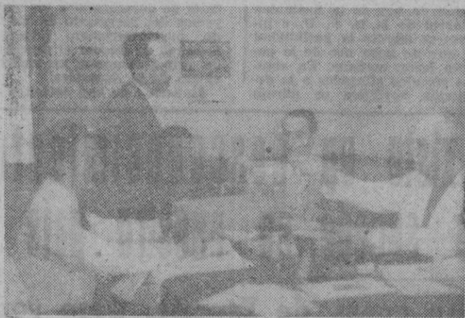
Un empleado de «Gas y Electricidad» en el momento de depositar su papeleta de votación.

esta responsabilidad de que acabamos de hablarle, pero un hombre como este productor que tenemos en frente, en cuyo cuerpo se confunden los clásicos trajes de los legionarios y las catraces de las balas, la aceptación complacida, porque ino en balde sirvió en la Cuarta Bandera! Otro empleado del Caucho me hace un ruego. —Solo tenemos una queja por disparidad de criterio con la dirección de la empresa, hoyamos tenido que recurrir a la Magistratura de Trabajo para resolver el abono de una paga que, estimamos nosotros, se nos debe de dar, según está dispuesto, en concepto de participación en los beneficios. Fué la votación de los emplea-