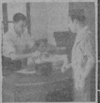
UN MOMENTO DE LA VOTACION EN LA FABRICA DE MANUFACTURA GENERAL DEL CAUCHO.