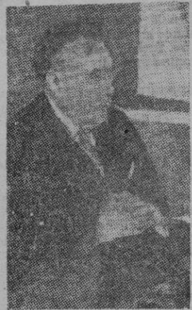
MYRON TAYLOR La voz de Roma Supremo refugio

La verdad es que la presente crisis de la humanidad es harto más grave de lo que a primera vista parece. Porque la crisis de hoy no consiste sólo en la bancarrota de bienes materiales, sino antes y sobre todo en un derrumbamiento espiritual que deja al hombre indefenso respecto a sí mismo, respecto a sus semejantes y respecto a la sociedad moderna y sus órganos. En estas condiciones naturalmente, la vida del mundo está afectada por un progresivo oscurecimiento, deformación y pérdida de los principios morales en grandes masas de hombres, en determinados sistemas políticos y hasta en pueblos enteros. Por consiguiente, el orden internacional se ha convertido en monstruoso rompecabezas, cuyas disparatadas convulsiones se manifiestan con una penuria material que azota a los pueblos pero cuya raíz es la miseria espiritual de las generaciones contemporáneas.