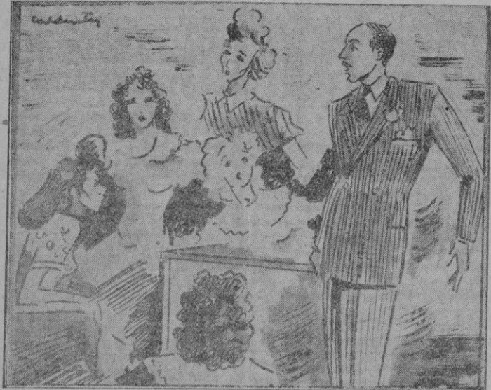
«Hasta que llegué yo y di mi conferencia...»

Les supongo enterados de que viajé tanto por países y territorios diversos que el relato de mis exploraciones y experiencias llena cinco grandes volúmenes, titulados «Todo es nuevo, si se sa-