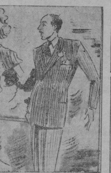
«Hasta que llegué yo y di mi conferencia...»

que las selvas inéditas; las costas de hielo, que los parajes interiores misteriosos allí donde se puede poner el pie, o ir flotando en un árbol hueco; e inconcebibles desérticos climas o entre los cui-