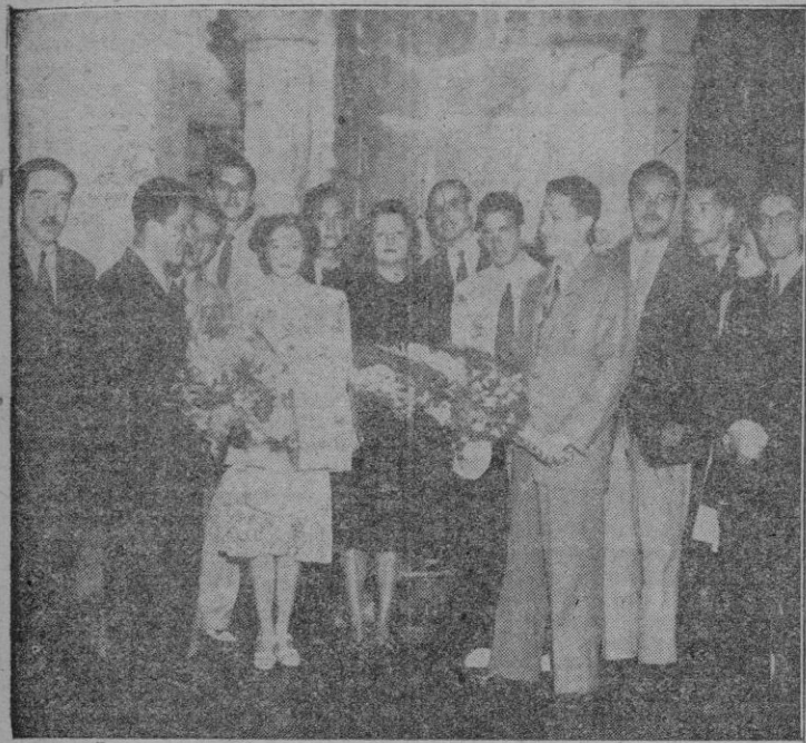
Santander. — La Excm. Sra. Condesa de Marín, esposa del ministro de Educación Nacional, y su hija, acompañadas de los estudiantes portugueses e hispanoamericanos que les hicieron objeto de un homenaje en la residencia de Monté Corban

HOMENAJE DE LOS ESTUDIANTES EXTRANJEROS A LA ESPOSA DEL MINISTRO DE EDUCACION NACIONAL