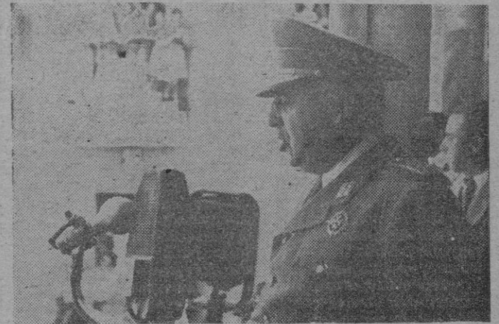
S. E. el Jefe del Estado, Generalísimo Franco, durante su discurso desde el balcón del Ayuntamiento de Sigüenza con motivo de la inauguración de la Catedral.

Fuerzas de artillería con bandera y banda de música, se situaron en las inmediaciones del Palacio para rendir honores al Caudillo, y a la entrada del edificio se congregaron todas las autoridades provinciales y locales, entre las que se hallaban el Capitán General de la Región, Arzobispo de la Diócesis, Gobernadores civil y militar, Generales