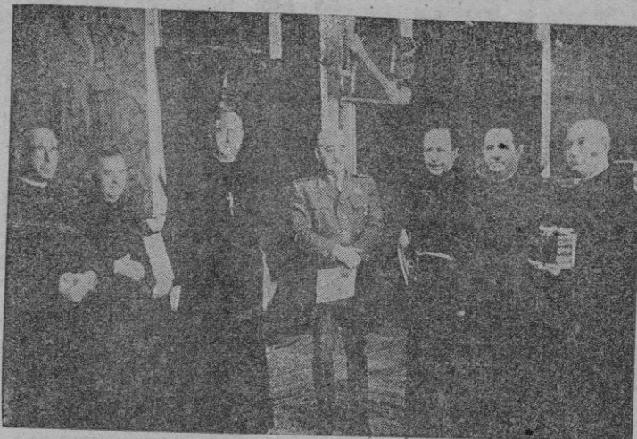
S. E. el Jefe del Estado, ha recibido en audiencia a la Comisión Permanente del Consejo Supremo de Misiones presidida por el Padre Legisima, que le ofreció sus respetos en nombre de todas las Ordenes Religiosas Misioneras.