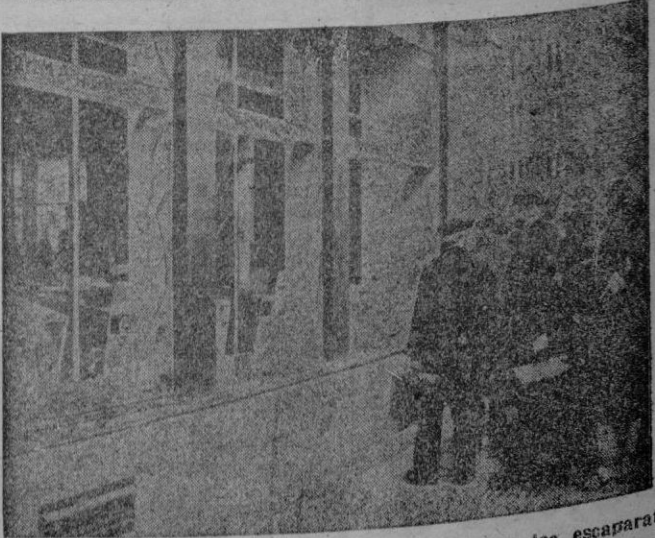
En la foto, se aprecia el estado en que quedaron los escaparates de un centro de propaganda comunista, que fueron rotos y quemados los folletos por los manifestantes en la noche del 18 de junio.