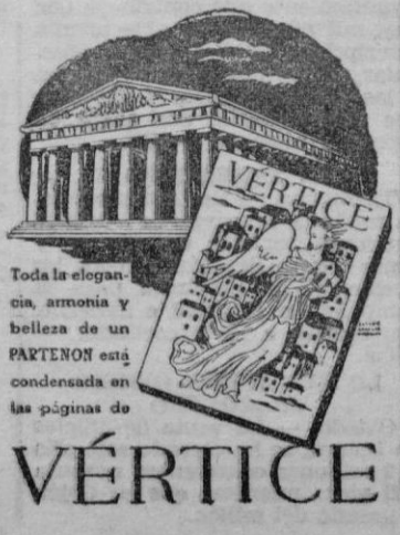
Toda la elegancia, armonía y belleza de un PARTENON está condensada en las páginas de