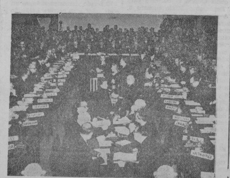
En Westminster, se celebró el 24 de Noviembre la sesión de aperturas de la Comisión preparatoria para la Asamblea de las Naciones Unidas que continúa todavía sus reuniones. He aquí un aspecto de la Sala de Juntas con todos los representantes de los diferentes países.