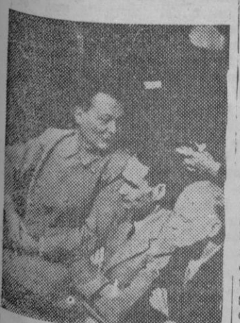
He aquí tres de las más populares figuras encartadas en el proceso de Nuremberg: Goering, Hess y von Ribbentrop. (S.O.C.)