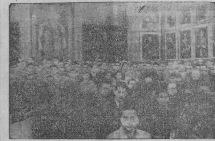
Nutridísimas representaciones de los Consejos Diocesanos de Hombres, Mujeres y Jóvenes, así como las del Clero regular y secular, asistieron a la clausura de la VII Asamblea Diocesana en la sesión solemne que se celebró el pasado domingo.

riados de Caridad; los frutos maravillosos obtenidos en el Apostolado del Dolor, de visitas a los enfermos de los hospitales y a los reclusos de las cárceles; el número cuantioso de los jóvenes que han hecho los Santos Ejercicios en completo retiro y que todos los meses practican el día de retiro; los múltiples e importantes actos de propaganda celebrados en distintas ciudades y pueblos de la isla, así como la extraordinaria importancia que revistieron los actos de la campaña de cristianización de la familia celebrados en Palma. Otros interesantísimos datos, que por falta de espacio nos resulta imposible recoger, figuraban también en la interesantísima Memoria.