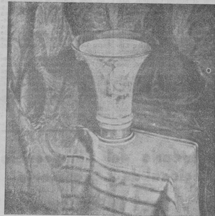
Uno de los hermosos bodegones expuestos en «Galerías Costas»