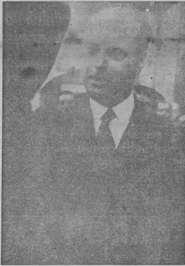
S. E. momentos después de desembarcar del «Ciudad de Palma»