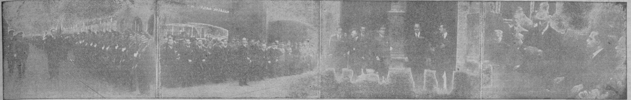
Diversos aspectos de la llegada a Palma del Excmo. Sr. Ministro de la Gobernación. — 1: S. E. revistando a las fuerzas de Infantería de Marina que le rindieron honores. 2: Presenciando el desfile de las mismas. 3: A la salida de la Catedral, acompañado por las primeras autoridades de la Provincia. 4: Presidencia del acto celebrado en el Ayuntamiento

«Quiero que vosotros me digais cuales son vuestras necesidades, para--a medida de las disponibilidades del Estado--dar satisfacción cumplida a los deseos de estas Islas, tan queridas por nuestro Caudillo, cuya Capitanía General tuvo en sus manos», declaró S. E. en su primer discurso pronunciado en el Ayuntamiento