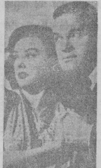
PAULETTE GODDARD y BOB HOPE

PRINCIPAL y ORIENTAL Film americano con Bob Hope, Paulette Goddard y Paul Lukas en los papeles principales. Presentada por la casa Paramount.