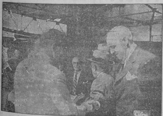
El Presidente de la Comisión de Diputados norteamericanos que visitan España, es saludado por el Cónsul de su país, al llegar a Sevilla.