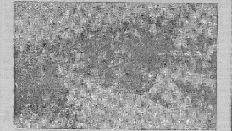
Un aspecto de la tribuna de preferencia del campo de «EL FORTI». Enorme concurrencia se asoció al acto

gando casi a llenarla por completo. En primer lugar se efectuó la bendición de la nueva bandera del club, que lleva en el centro el escudo del C. D. Mallorca, aguan-