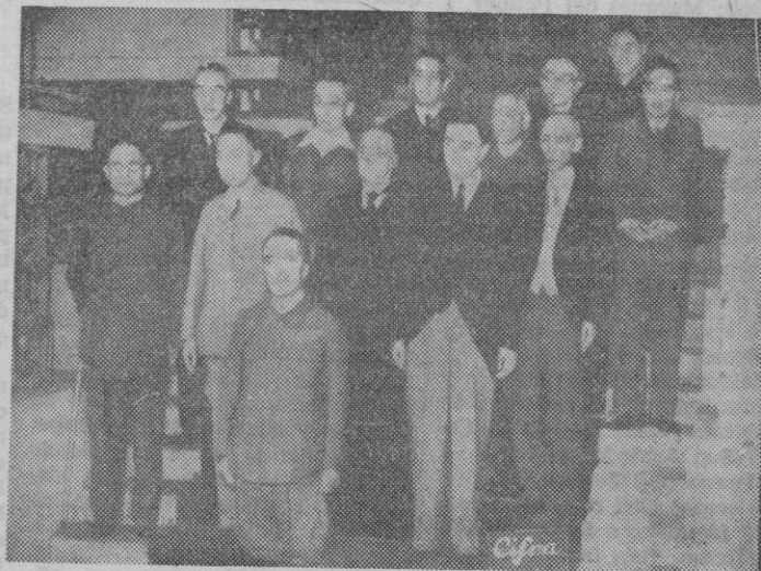
El Príncipe Higashi Kuni, con los miembros de su Gabinete, después de la capitulación