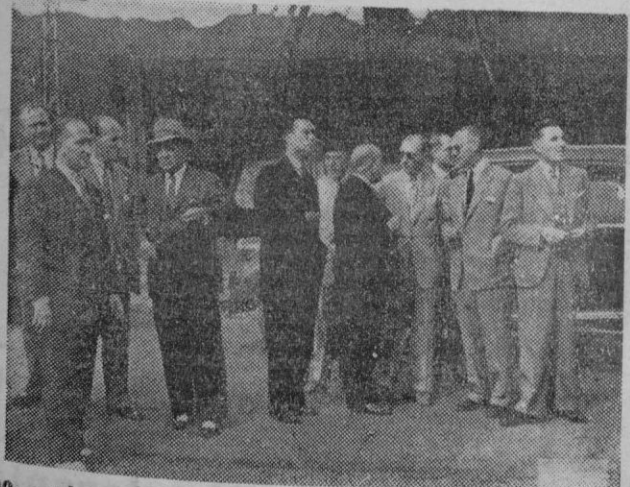
Bilbao. — Los delegados belgas y franceses que están estudiando acuerdos comerciales con España en San Sebastián, visitan los Altos Hornos de la famrij ciudad.