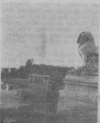
La pertinaz sequía en Madrid está causando verdaderos estragos. En la fotografía puede apreciarse la falta de agua que padece el estanque del Retiro con lo cual ha perdido parte de su encanto.

San Sebastián. — Pocos minutos después de las diez de la noche salió del Palacio de Ayete S. E. el Jefe del Estado acompañado de su esposa, los Jefes de las Casas Militar y Civil y sus ayudantes y se trasladaron a la Diputación con objeto de asistir a la comida que en su honor le daba la Corporación Provincial.