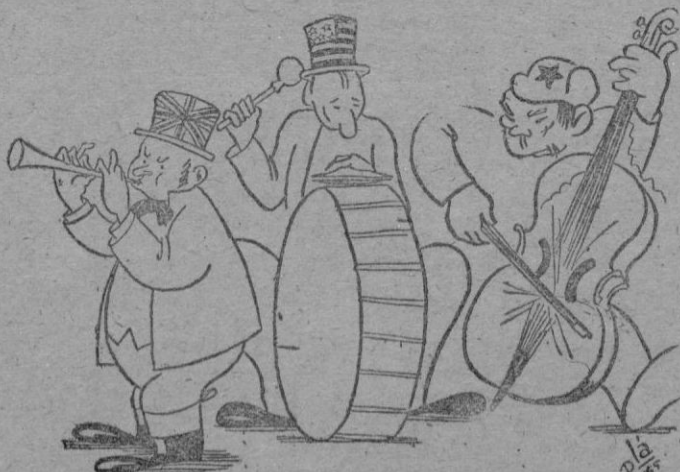
—¿No les parece a Vds. que el del violín desafina bastante?