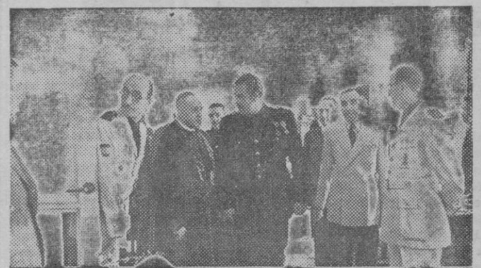
El Ministro de Trabajo, camarada Girón, acompañado del Obispo de Madrid-Alcalá y jerarquías nacionales y autoridades recorre las diversas dependencias del nuevo local inaugurado del Instituto Nacional de Previsión, en Madrid.