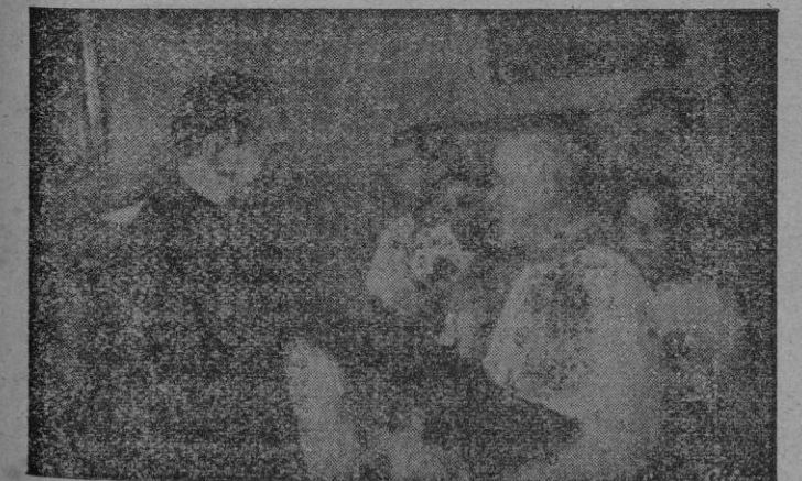
Madrid. — El Ministro Secretario General del Movimiento conversa con los miembros de la Rondalla de Educación y Descanso de Carella, durante la visita de éstos últimos a la Secretaría General del Movimiento.