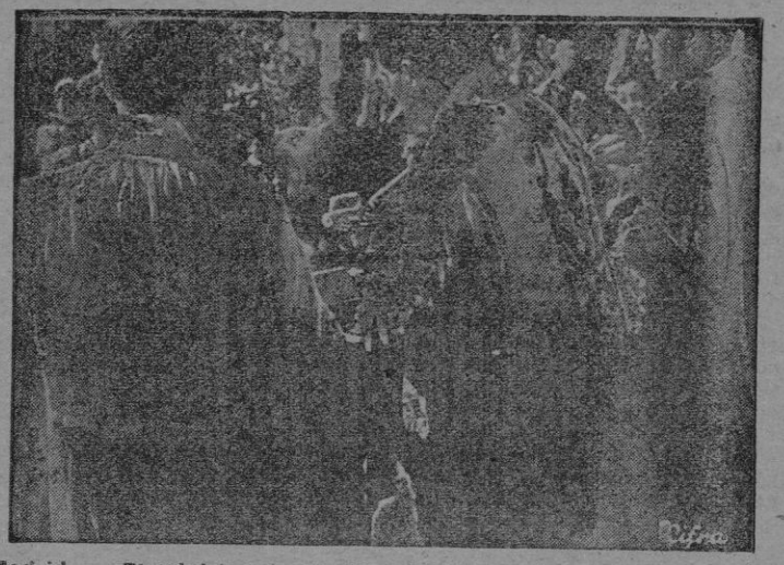
Madrid. — El ministro de Marina, Almirante Moreno, comulga durante la misa celebrada en el Cerro de los Angeles con motivo de la Peregrinación Nacional.