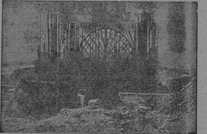
Madrid. — Estado de las obras del nuevo monumento al Corazón de Jesús en el Cerro de los Angeles, que sustituirá al que destruyeron los rojos.