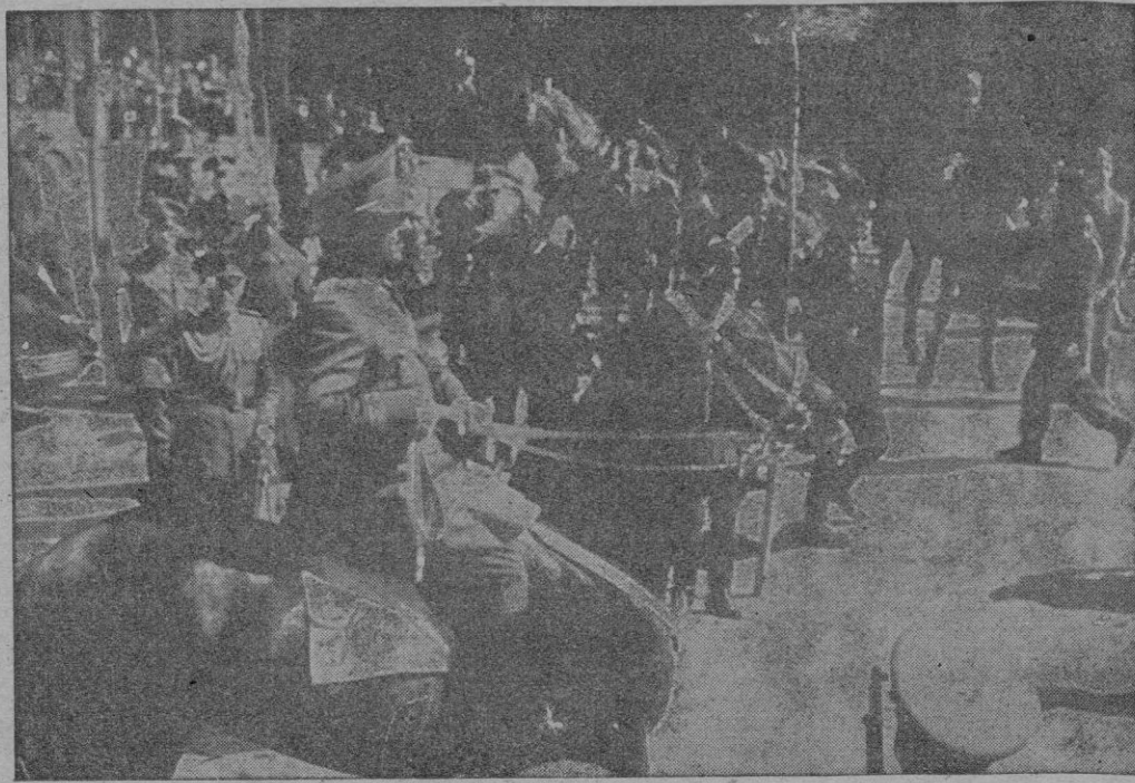
El Caudillo acaba de montar a caballo y se dirige a revistar las tropas que tomaron parte en el imponente desfile militar