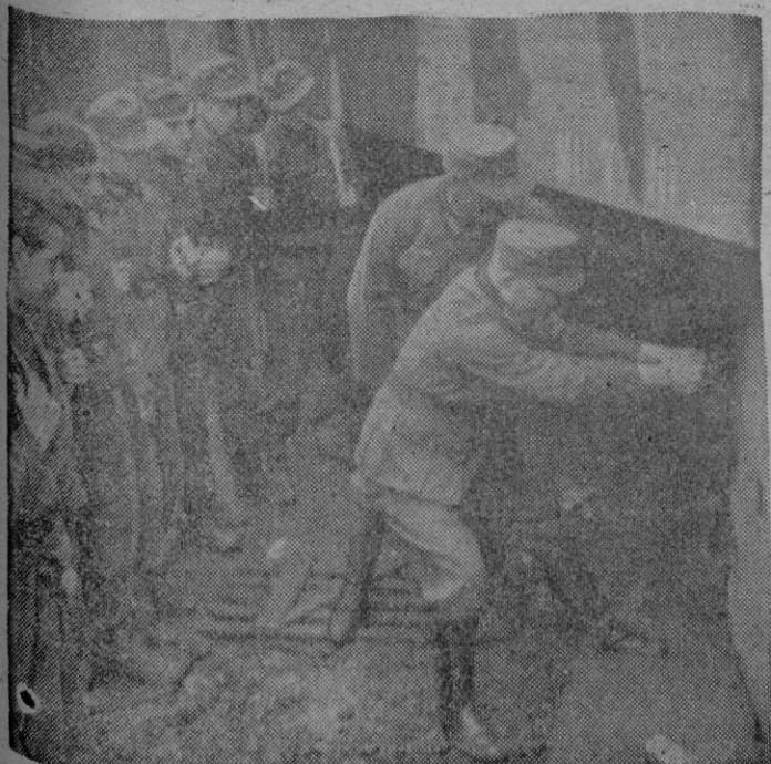
Levas juveniles van nutriendo los cuadros de nuevas unidades de la S. S. alemanas, que, como muestra la foto, reciben toda clase de instrucción