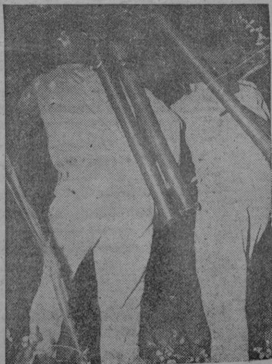
NUEVAS ARMAS LANZACOHETES

Una nueva versión plegable del «bazooka» lanzacohetes portátil americano