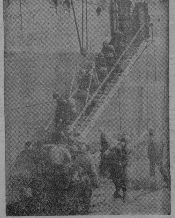
MAS TROPAS NORTEAMERICANAS AL OESTE

Momento de introducir bajo la proba de un «fortaleza volante» un bote salvavidas que se lanza, en caso de necesidad, mediante tres paracaidas