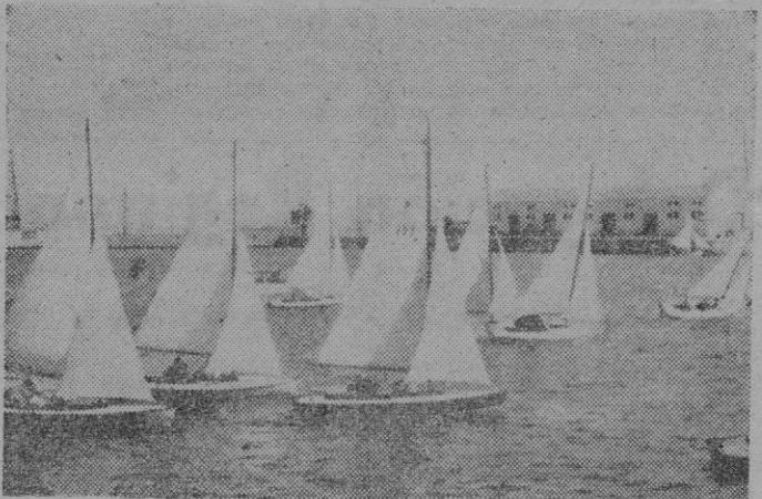
Momentos después de darse la salida a los «snipes» que tomaron parte en la quinta prueba de la «Regata de San José»

El domingo se corrió la quinta y última prueba de la regata de San José, de la serie «snipe», en la cual han participado los más destacados «snipistas» de las flotas de Mallorca, que en las cinco pruebas de que ha consistido la regata han puesto a contribución su pericia y deportividad para hacer interesante la regata, habiéndolo conseguido.