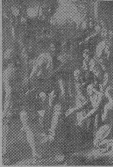
EL PASMO DE SICILIA

Acaso nada más realista que cause tanto estupor y miedo como el cuadro de Tíepolo al interpretar la flagelación de Cristo. Las figuras endemoniadas, llenas de fanático odio de los soldados romanos. Fueron hombres surtidos en las batallas, sin espiritualidad, sin cariños humanos, con las blasfemias en los labios y el rencor en los corazones