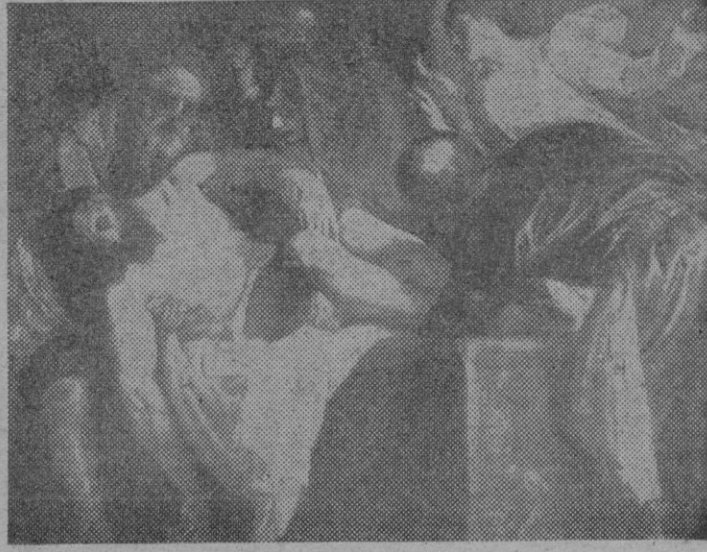
ENTIERRO DE CRISTO

Cristo ha caldo, Alza la faz y contempló a su Madre. Rafael ha dado una dulce interpretación a esta escena. Las Santas Mujeres de Jerusalén acompañan a la Virgen María