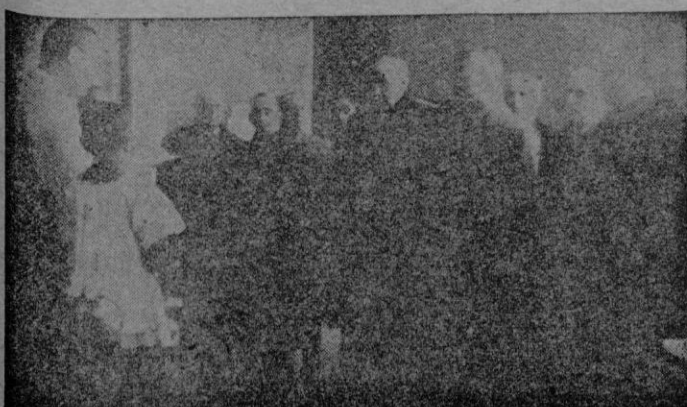
Autoridades que presidieron el acto inaugural celebrado el día 16. Momento de la solemne bendición del nuevo edificio