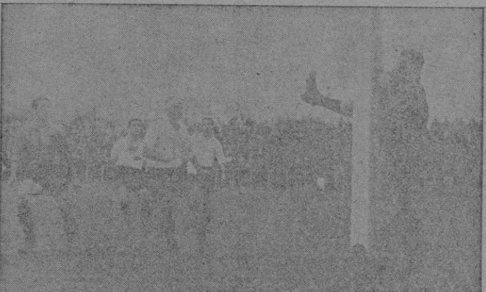
Company bloea un tiro de Picoqui