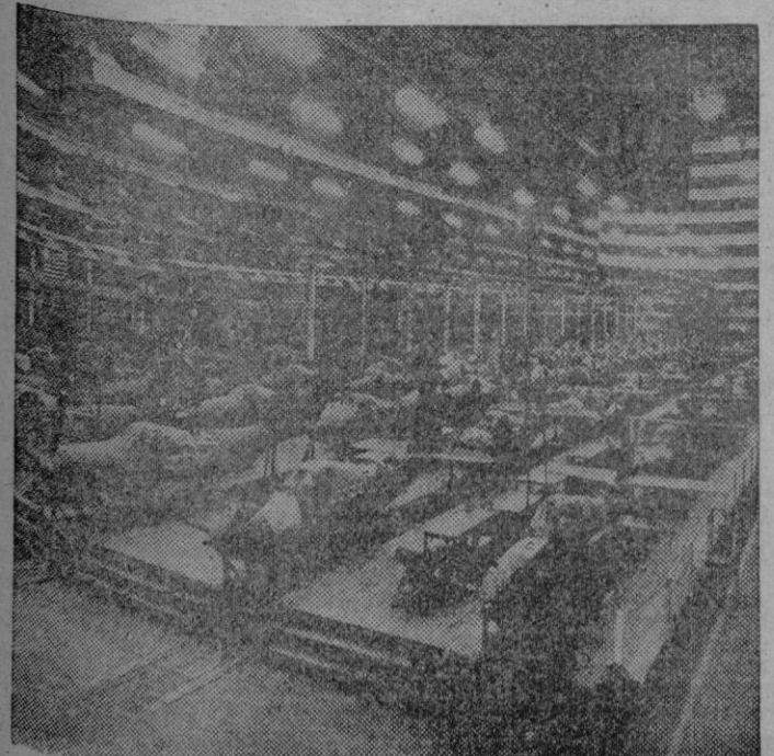
Una cadena de montaje de una fábrica norteamericana, donde se producen los cazas de gran radio de acción «Kingcobras P. 63»