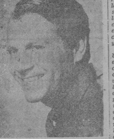
JOEL MAC CREA

de canciones, pues últimamente se ha revelado como excelente músico y poeta, puesto que también es el autor de la letra de sus canciones.