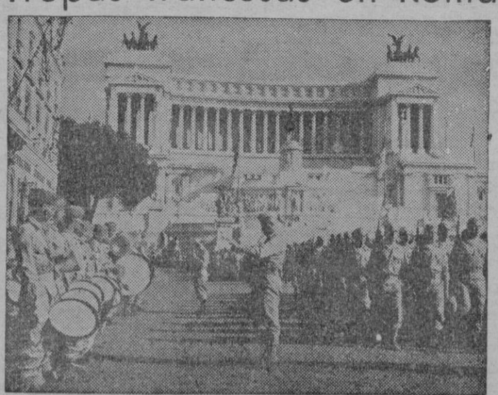
A los acordes del Himno Nacional francés, las tropas de las Fuerzas Expedicionarias Francesas desfilan por una plaza de Roma