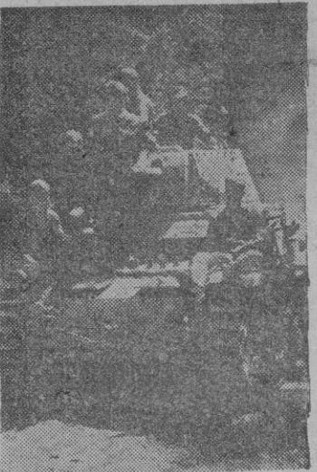
Tanques alemanes se dirigen hacia el frente húngaro-rumano