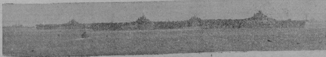
Vemos aquí una flotilla de cuatro portaaviones norteamericanos anclada en una base del Pacífico