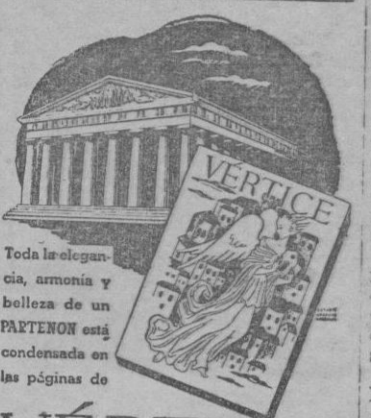
Toda la elegancia, armonía y belleza de un PARTENON está condensada en las páginas de

El domingo fué clausurada la Feria de Muestras que ha sido visitada por mas de 97 mil personas, que pudieron admirar el número o la calidad de los productos insulares expuestos. Con motivo de la clausura, fué extraordinario el número de visitantes, quienes demostraban su sentimiento ante el cerrojazo que se iba a dar a tan interesante certamen isleño.