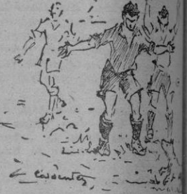
La escena preliminar del encuentro. Pocovi y el extremo izquierdo del Celta, Roig, hacen lo posible para expulsar del campo al perrito inoportuno