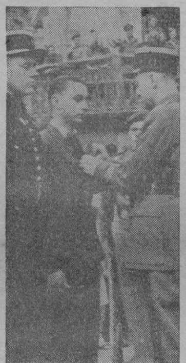
El gendarme francés que guió a las tropas inglesas en Bayeux, y un francés de las fuerzas del interior, reciben la Cruz de Guerra.