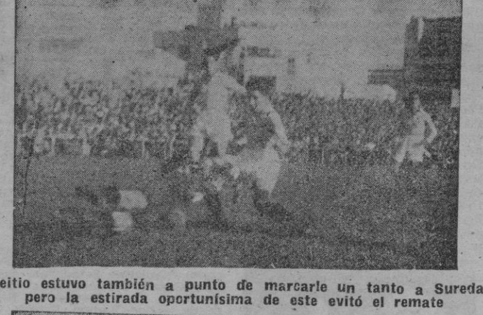
Aretio estuvo también a punto de marcarle un tanto a Sureda, pero la estirada oportunísima de este evitó el remate