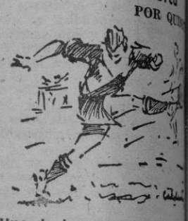
Uno de los maravillosos momentos de Gil