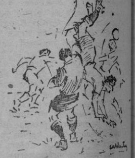
Gil, que dió siempre la cara pasar por encima de su rival corpulento Muruaga, en la bastante espectacular