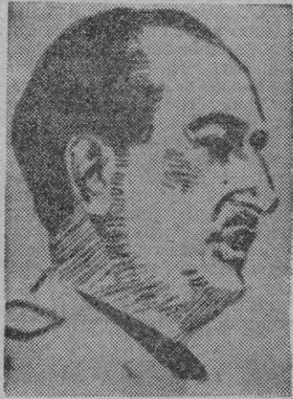
CAMARADA ARRESE, MINISTRO SECRETARIO GENERAL