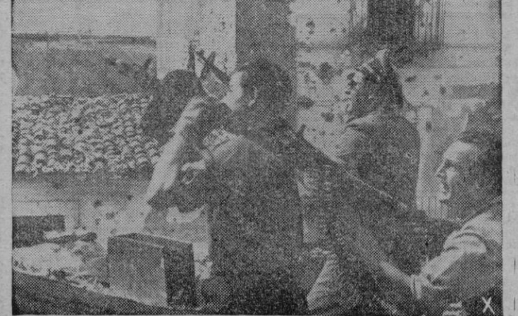
En una pequeña localidad ocupada por tropas germanas se ha dado la alarma ante la presencia de los aparatos enemigos. Todas las armas se ponen al servicio de la defensa antiaérea.