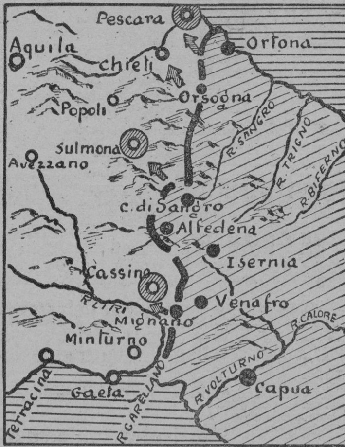
Gráfico del actual campo de batalla

Participan en la misma tropas francesas y polacas