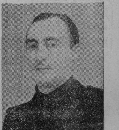
Los camaradas José Antonio Girón y Miguel Primo de Rivera