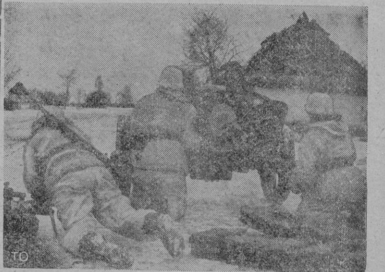
Protegido por una «isba» de una aldea este antitanque germano se prepara para rechazar un ataque de tanques soviéticos.