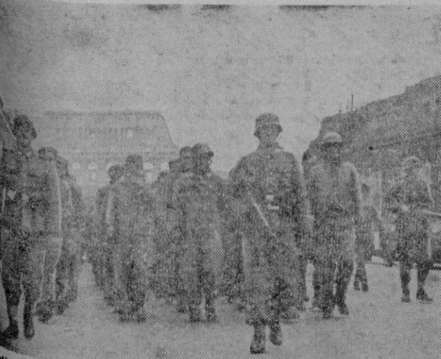
Atacados por soldados alemanes, cientos de prisioneros americanos capturados en Cassino marchan al campo de concentración.