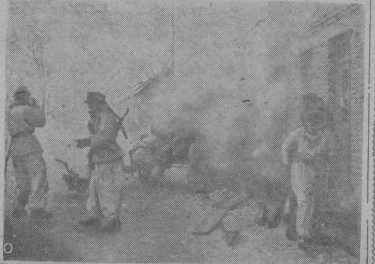
Tropas alemanas de montaña han localizado una banda de francotiradores de Tito en una aldea. Debido a su obstinada resistencia se ven obligados a incendiar las casas que les servían de fortín.