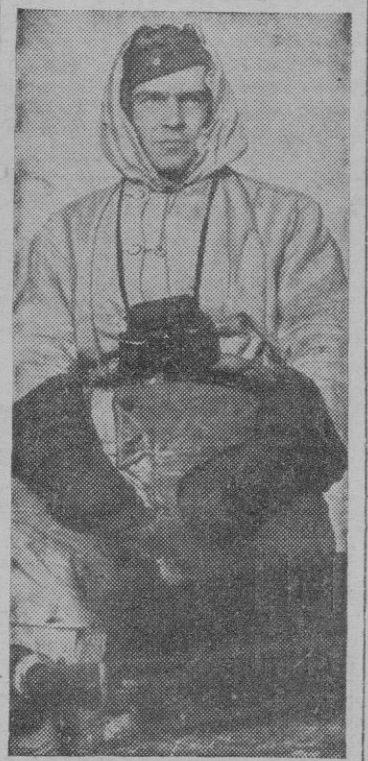
Aquí vemos a un joven Capitán Comandante de un tanque superpesado tipo «Tigre», cteando la línea enemiga, en el sector septentrional de Rusia.