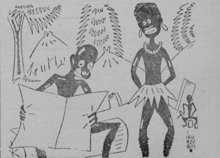
El antropófago (leyendo): — Doscientos muertos en un bombardeo con fósforos. ¡Y luego se quejaban de nosotros porque alguna vez asábamos a un infeliz explorador!...

Un retraso en la recepción del papel destinado a nuestro periódico, nos obligó a una reducción del número de páginas iniciada días atrás. El bloque de trenes y en general de todas las comunicaciones con motivo de los recientes temporales ha aumentado todavía el retraso y por noticias recibidas ayer sabemos que solo hasta dentro de unos días podrá ser desembarcado en Palma el envío, ahora detenido en Cataluña. Con su llegada volveremos a nuestro número ordinario de páginas cuya reducción se debe tan solo al motivo que dejamos apuntado.