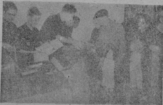
Camaradas del Frente de Juventudes en funciones de «Reyes Magos»