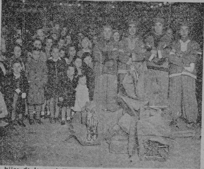
Los hijos de los periodistas rodean a los Pajes Reales y a los paquetes repletos de juguetes que colmaron la ilusión de los pequeños