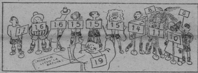
La clasificación en la II División al terminar la primera vuelta