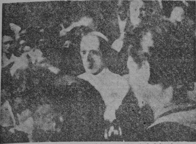
S. S. Pío XII, obispo de Roma, visita en esta ciudad los lugares sinistrados, entre el pueblo romano que le mira respetuosamente.