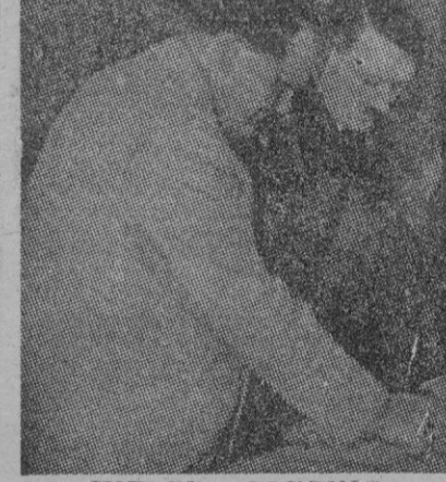
HITLER y GOERING

Berlín.—Han sido celebradas en el Cuartel General del Führer estos últimos días una serie de importantes entrevistas de carácter militar y político, a las que han asistido entre otras personalidades, el mariscal del Reich Hermann Goering el Ministro de Asuntos Exteriores von Ribbentrop, el ministro Speer, Jefe de S. S. J. Himmler, el ministro Dr. Goebbels y el Reichsleiter Bormann.