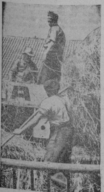
Campesinos alemanes que con su esfuerzo colaboran también en la victoria de su patria.