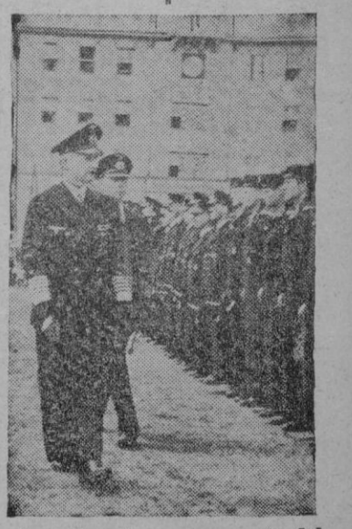
A su llegada a un puerto del Mediterráneo el Gran Almirante Doenitz, revista las fuerzas que le rinden honores.

«REVOLUCION LA HEMOS LLAMADO DESDE EL PRIMER DIA, PUES AUNQUE A ALGUNOS ESPIRITUS TIMORATOS LES ASUSTA LA PALABRA, NO EXISTE OTRO MEDIO MAS APROPIADO DE DESIGNAR «EL CAMBIO VIOLENTO EN LAS INSTITUCIONES POLITICAS DE UNA NACION Y LA MUDANZA EN EL ESTADO Y GOBIERNO DE LAS COSAS». Y PRECISAMENTE ESTO ES LO QUE REALIZA EL MOVIMIENTO, AUNQUE ALGUNOS GRUPOS CONSERVADORES, ABURGUESADOS Y BLANDUCHOS NO ACABEN DE COMPRENDERLO; DANDOSE EL CASO PARADOJICO DE QUE APARENTEN NO CREER EN AQUELLO AUNQUE LE DEBEN LA CONSERVACION DE SUS PATRIMONIOS».