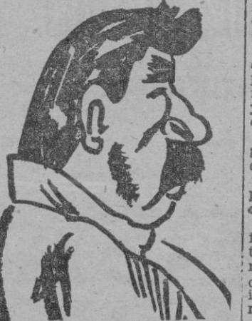
JOSEF DSCHUGASCHWILLI llamado Stalin el mismo Stalin sobre los actos de la Unión Soviética.

Partido — tiene un sin fin de parientes cercanos y amigos judíos colocados en los puestos más importantes. De ahí su apodo de «patriarca de la Unión Soviética».