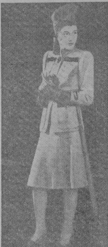
Un bello modelo de traje de calle en tejido de lanilla de tono claro. Lleva grandes bolsillos sobrepuestos en la chaqueta y unas franjas transversales de color oscuro en el delantero

gún «Adela», una guerra, un motín o una asonada cualquiera de las que por entonces abundaban, servían para que modistos, sombrereros y zapateros lanzasen un nuevo modelo, hoy las cosas, al cabo de cerca de cien años no han variado apenas, y así, con motivo del actual conflicto bélico, hemos visto cómo nuestras mujercitas han sabido aprovecharlo para lanzar nuevos modelos, como por ejemplo esos zapatos estilo «tanque», y tantas otras creaciones más o menos extravagantes que en ciertos países recuerdan, en el atuendo femenino, máquinas o utensilios bélicos.