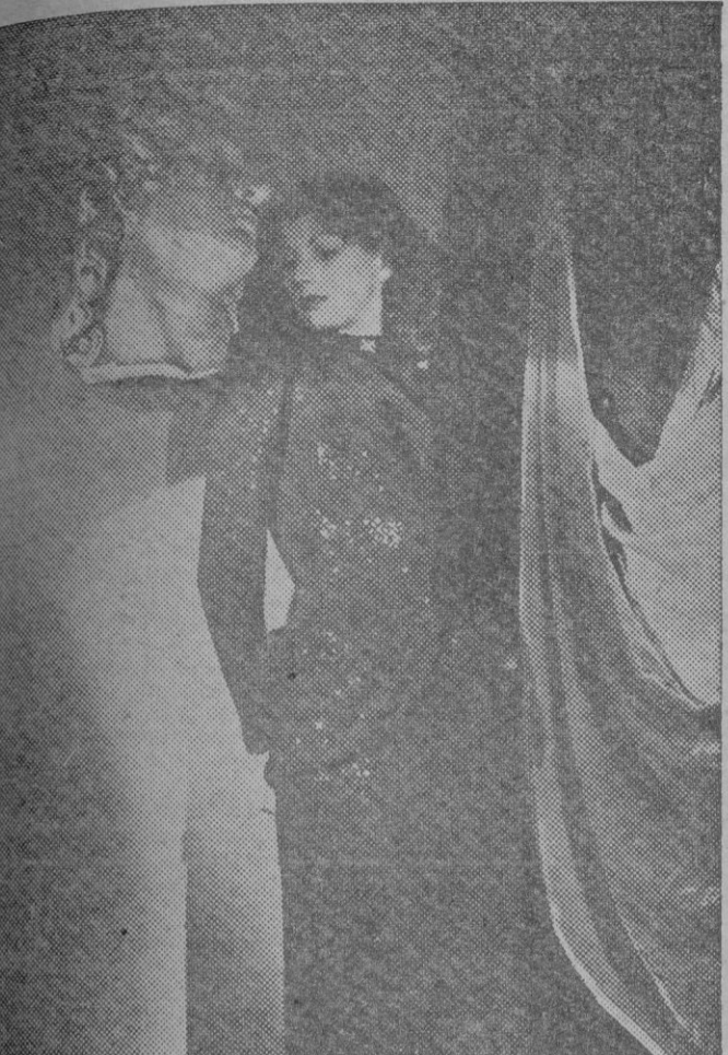
Este elegante modelo de vestido de tarde muestra una graciosa modalidad de chaqueta de líneas curvas y pliegues laterales. Como adorno lleva un caprichoso bordado irregular de lentejuelas, y un prendido metálico en el cuello