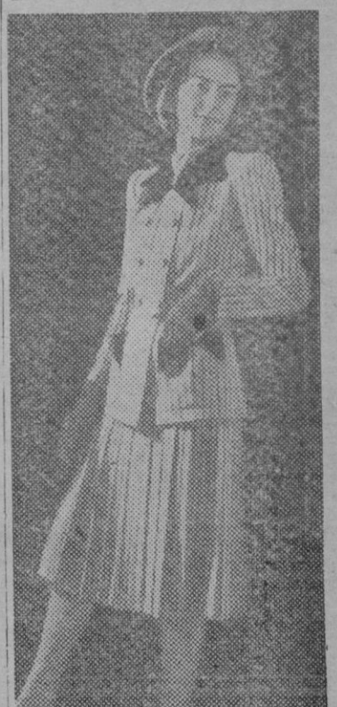
Traje chaqueta, suelta por el delantero y levemente entallada por la espalda.

Trasladarlos a la fuente con su salsa suprimiendo el ramito.