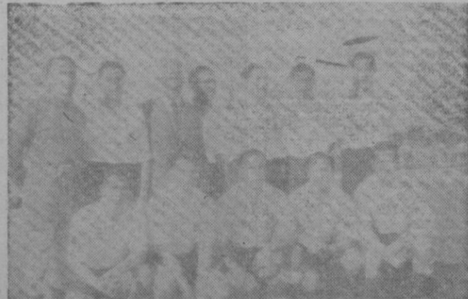
Equipo del C. D. Constancia