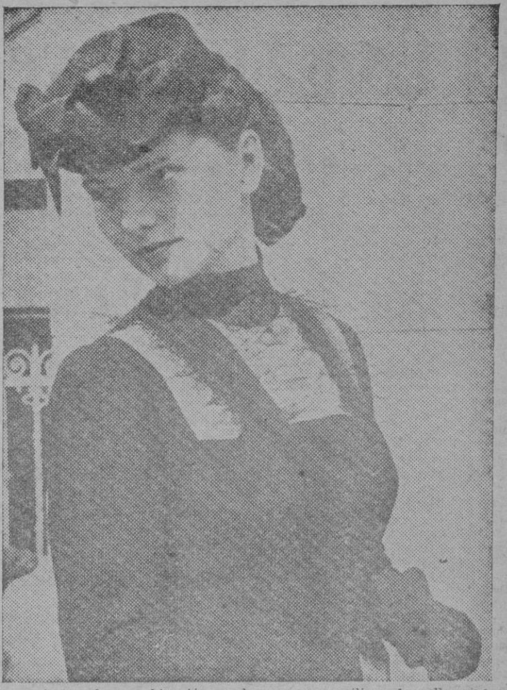
Una afortunada combinación en la que se concilian el cuello ajustado a modo de gargantilla y la línea cuadrada del escote figurado

Enjuagáos en cambio el cabello con shampoo, para darle reflejos y matices de tono castaño o caoba. Esto os facilitará la tarea de encontrar colores apropiados. Pero no olvidéis utilizar los efectos. Y recordad sobre todo que los colores vivos son para los tipos femeninos de gran vitalidad y animación. Los menos definidos, deberán buscar tonos y matices más suaves. Podéis, desde luego, usar muchos más colores de los indicados para un tipo definido, pero siempre evitando por igual caer en la monotonía o en la extravagancia.