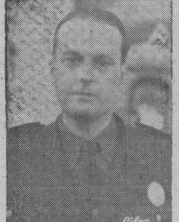
MINISTRO DE LA GOBERNACION

donde procedió a la inauguración oficial de la Exposición de los aparatos e instalaciones utilizadas en la explotación, desde su comienzo y que dan una idea exacta del desarrollo de la técnica de la telecomunicación en nuestro país.