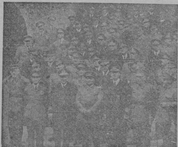
Fotografía obtenida después del acto celebrado en Capitanía General, con motivo del homenaje a la gloriosa Marina Nacional ofrecido por el Excmo. Sr. Capitán General Jefe de las fuerzas de Tierra, Mar y Aire de Baleares

Del homenaje ofrecido por S. E. el Capitán General de Baleares a la Marina