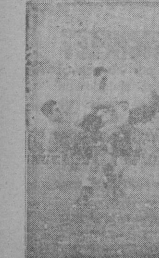
Así fué marcado, en el último momento del encuentro, el tanto de la victoria para el Constancia. De nada le sirvió a Sureda la estirada a los pies de Ostolaza