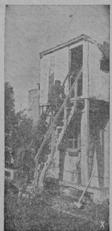
Puesto alemán de observación de una de las baterías entregadas de la defensa del Jibraltar europeo.