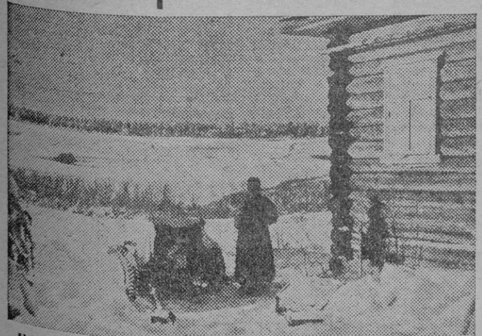
Un soldado alemán monta la guardia al lado de una pieza antitanque

ES ABSURDO PENSAR QUE NOSOTROS PUDIERAMOS EXHIBIR, COMO DERCHO DE AUTODISPOSICION, EL MILLON DE MUERTOS QUE NOS COSTO LA VICTORIA ANTERIOR. NINGUN DERECHO NOS SERIA RESPETADO; SINO AQUEL QUE DE NUEVO CONQUISTARAMOS CON OTRA GUERRA MAS CRUDA Y CON OTRO SACRIFICIO MAS DURO TODAVIA