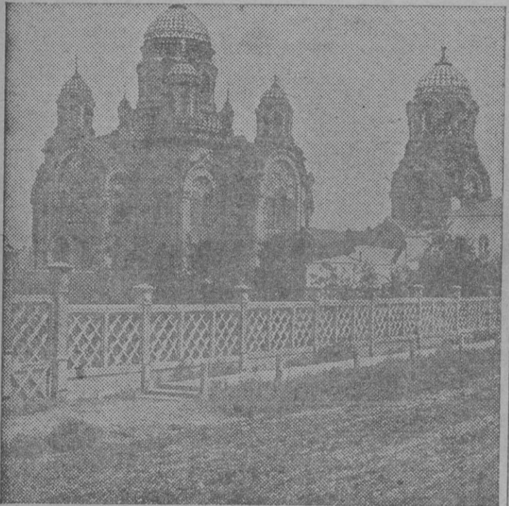
Irkutsk era la antigua capital de la Siberia, situada en la margen derecha del Ankara, en su confluencia con el Irkut. Era famosa por sus edificios y templos, hoy profanados con los museos de los soviets rusos

Hoy, contra el comunismo, contra los enemigos de dentro y de fuera, se reafirma en su puesto de combate a las órdenes de Franco, Jefe y Caudillo, con la misma disciplina, con el mismo fervor y con la misma fe de ayer.