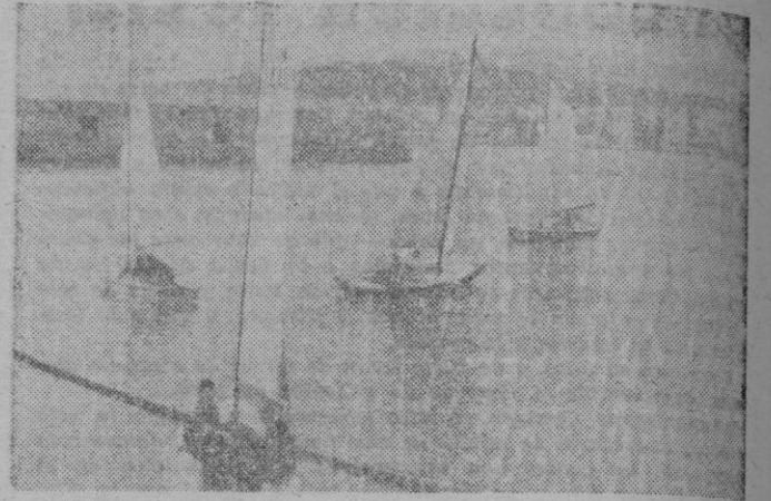
La salida de la flota de «becasines» para participar en la «Copa Invierno de 1943» en la que resultó vencedor de la primera regata «Altair», tripulado por A. Coll.

El domingo empezó de nuevo sus actividades la flota de «becasines» del R. C. de Regatas, habiéndose organizado la competición «Copa de Invierno de 1943» disputada en cinco regatas diferentes, puntuando las embarcaciones.