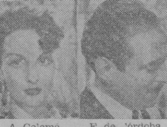
A. Colomé F. de Jórdoba pañola que lucha ajetosamente por encontrarse a sí misma.

Greta Garbo es una actriz tan famosa como excelente. Para que surja al primer plano de la actualidad —se dice así— no es absolutamente indispensable que filme una nueva película, ni que haga una declaración sensacionalista o no, sobre cualquier acontecimiento mundial. Greta Garbo siempre es primera actualidad.