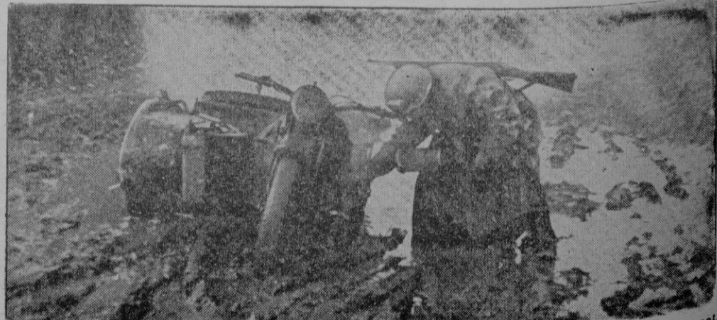
En esta foto vemos las dificultades que las malas carreteras y el pésimo clima ocasionan a los soldados alemanes. Unos motoristas realizando grandes esfuerzos para salir de un atolladero.