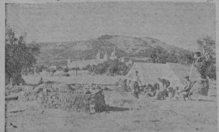
En estos días se está celebrando en el Campamento «Santa María» el II Consejo Nacional del Frente de Juventudes con asistencia de Delegados representantes de todas las provincias españolas, poseedores y Protectorado. Los Consejeros están acampados en tiendas de campaña plantadas delante de la magnificencia severa del Monasterio escorialense, tumba del Fundador. Aspecto que ofrecía la preparación y montaje del Campamento