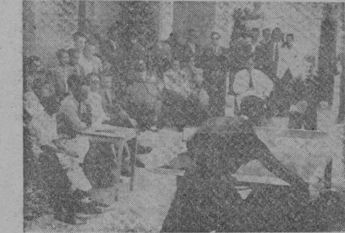
Un aspecto de las terrazas del C. N. Palma durante la celebración de unos partidos de Ping-Pong.

Amengual, Minguell, Arguimou Armando y Carlos. Equipo azul: Pampillón, Pocolvi, Escanellas, Martorell, Busch y Maura. Después de un partido bastante igualado el resultado justo fue el de un empate a 4 tantos. Los jugadores demostraron todavía no estar muy prácticos con el patín, pues los hubo que caían a cada momento, pero al numeroso público congregado le gustó y aplaudió muchas jugadas. Y por último se jugó el partido de baloncesto entre los primeros equipos del Veloz Sport Balear y del Club propietario, el resultado final fué de 31 a 27 a favor de los muchachos del Veloz.