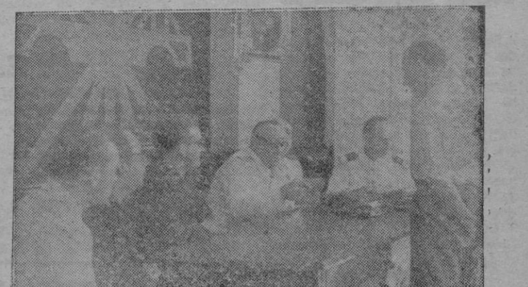
El Excmo. Sr. Almirante Jefe de la Comandancia Naval de Baleares presidiendo con el Delegado Provincial de Sindicatos el acto en la C. N. S.